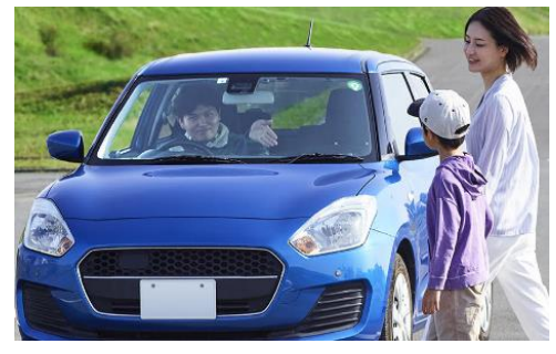
※ドライバーが歩行者を優先していることを手等で表現する。